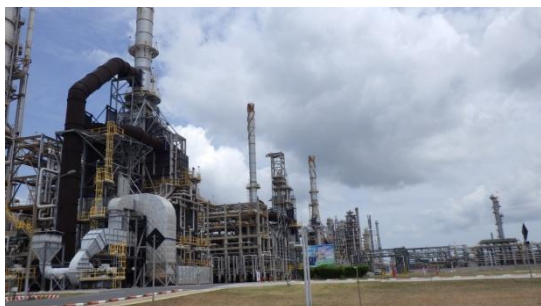
ภาพรวมของโรงกลั่นน้ำมัน