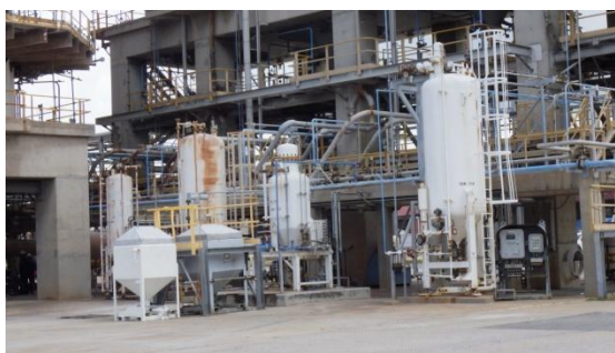
รูปที่ 3-17 DeSO x Catalyst ที่ RFCCU