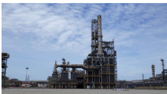
Platformer & CCR