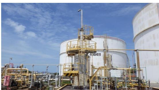
รูปที่ 3-19 Caustic Scrubber