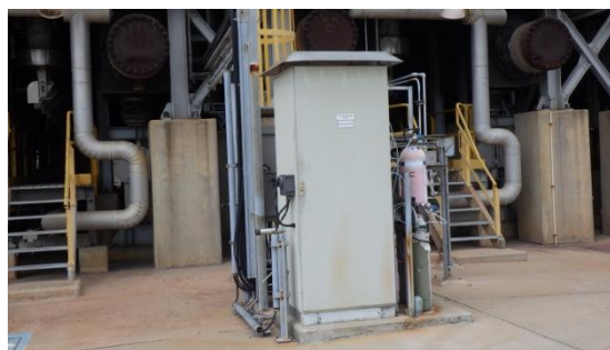
รูปที่ 3-16 CEMS ของปล่อง NHTU/CCRU