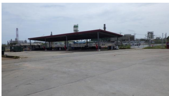
รูปที่ 3-28 พื้นที่พักกากของเสีย