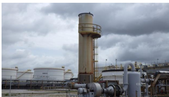
รูปที่ 3-23 ETP Ground Flare