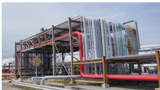
รูปที่ 3-53 Pipe Rack สำหรับท่อขนส่งน้ำมัน