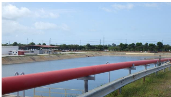
บ่อรวบรวมน้ำฝนที่มีโอกาสปนเปื้อน (Potentially Contaminated Storm Water Holding Pond)