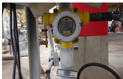
รูปที่ 3-20 H 2 S Detector

ภาพถ่ายประกอบการปฏิบัติตามมาตรการป้องกันและแก้ไขผลกระทบสิ่งแวดล้อม