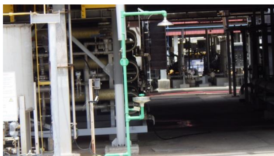
รูปที่ 3-39 ฝักบัวและอ่างล้างตาฉุกเฉิน