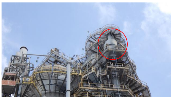
รูปที่ 3-11 Cyclone ที่ RFCCU