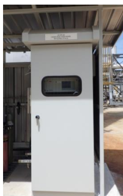
รูปที่ 3-13 CEMS ของปล่อง Boiler