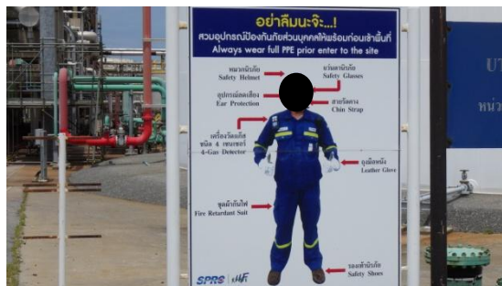
รูปที่ 3-42 ป้ายเตือนสวมใส่อุปกรณ์คุ้มครอง ความปลอดภัยส่วนบุคคล