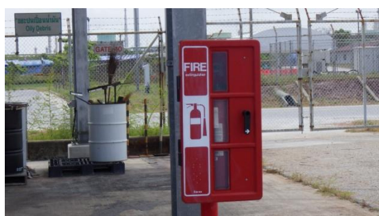
รูปที่ 3-30 อุปกรณ์ป้องกันและระงับอัคคีภัยบริเวณพื้นที่พักกากของเสีย

ภาพถ่ายประกอบการปฏิบัติตามมาตรการป้องกันและแก้ไขผลกระทบสิ่งแวดล้อม (ระยะดำเนินการ) โครงการโรงกลั่นน้ำมัน บริษัท สตาร์ ปิโตรเลียม รีไฟน์นิ่ง จำกัด (มหาชน)