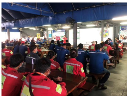
รูปที่ 3-45 การประชุมประจำวันของผู้รับเหมา