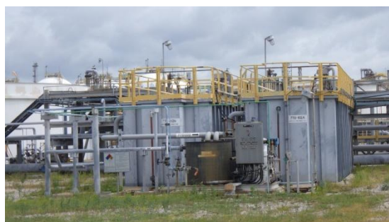
ระบบบำบัดน้ำเสียจากอาคารสำนักงาน (Sanitary System)