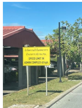
รูปที่ 3-34 ป้ายจำกัดความเร็ว

ภาพถ่ายประกอบการปฏิบัติตามมาตรการป้องกันและแก้ไขผลกระทบสิ่งแวดล้อม (ระยะดำเนินการ) โครงการโรงกลั่นน้ำมัน บริษัท สตาร์ ปิโตรเลียม รีไฟน์นิ่ง จำกัด (มหาชน)