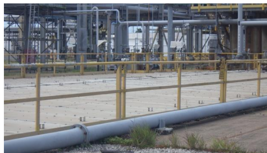
รูปที่ 3-22 ฝาดับที่ API Oil/Water Separator