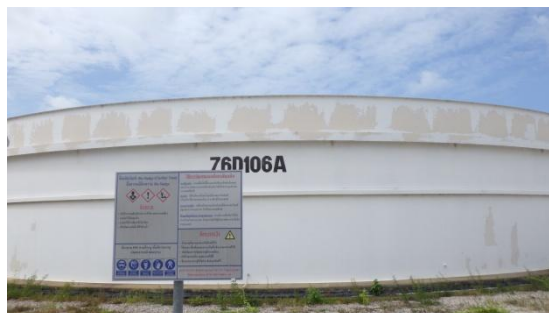
บ่อดกตะกอน (Bioreactor Clarifier)