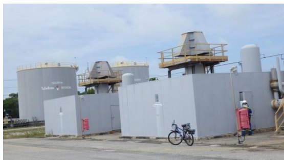
รูปที่ 3-41 Enclosure