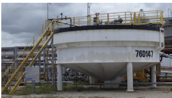
หน่วยแยกน้ำมันออกจากน้ำเสีย (Induced Air Flotation Unit)