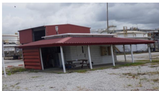
รูปที่ 3-44 ห้องปรับอากาศ