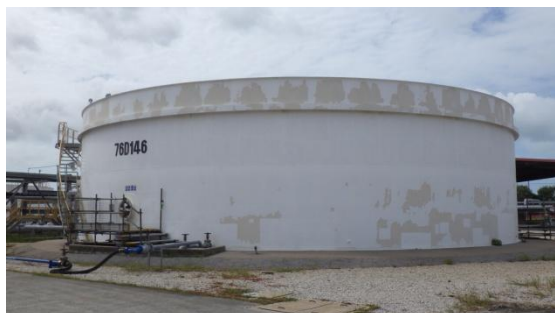
บ่อเติมอากาศ (Bioreactor Tank)