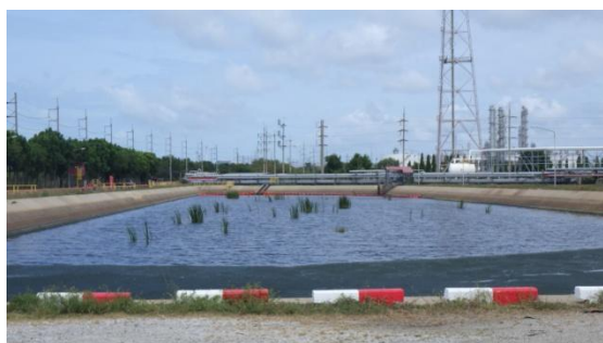
บ่อพักน้ำเสียที่ผ่านการบำบัดแล้ว (Polishing Pond)