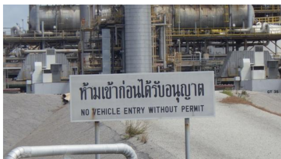
รูปที่ 3-43 ป้ายแสดงเขตพื้นที่หวงห้าม