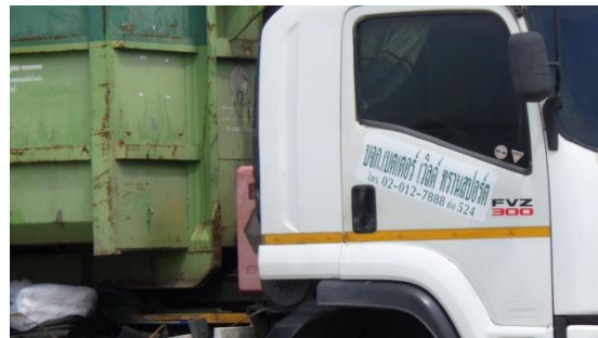
รูปที่ 3-33 การติดหมายเลขโทรศัพท์ที่รถขนส่ง