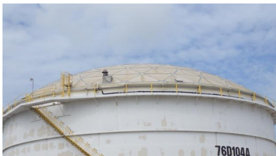
รูปที่ 3-21 ฝารอบถัง Equalization เพื่อลดกลิ่น