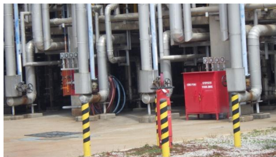
รูปที่ 3-52 อุปกรณ์ป้องกันและระงับอัคคีภัย บริเวณถัง B100