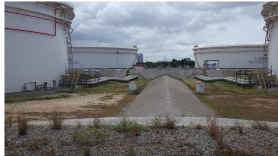
รูปที่ 3-32 คันกั้นบริเวณพื้นที่ลานดังักเก็บ