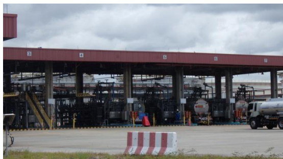
รูปที่ 3-51 สถานีสูบน้ำดิบทางรถ