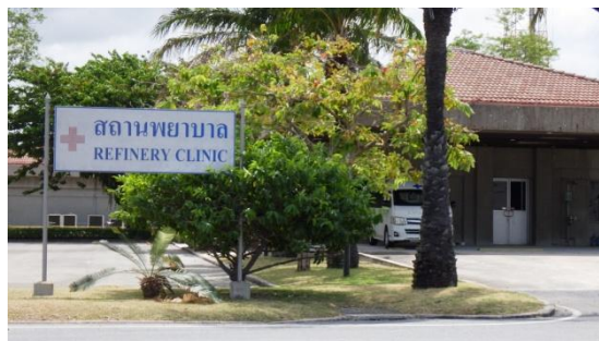
รูปที่ 3-36 สถานพยาบาล