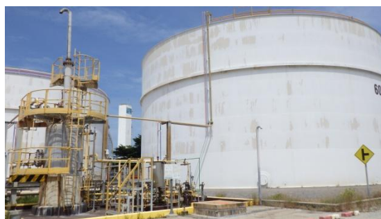
Sour Water Feed Tank