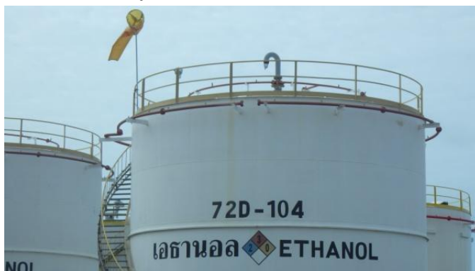
รูปที่ 3-49 Safety Valve และ Water Spray ของถังเอทานอล

ภาพถ่ายประกอบการปฏิบัติตามมาตรการป้องกันและแก้ไขผลกระทบสิ่งแวดล้อม (ระยะดำเนินการ) โครงการโรงกลั่นน้ำมัน บริษัท สตาร์ ปิโตรเลียม รีไฟน์นิ่ง จำกัด (มหาชน)