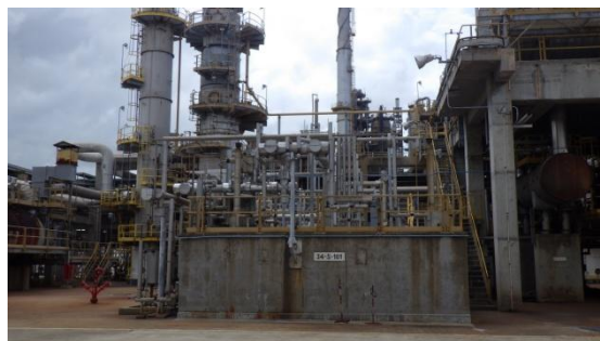
รูปที่ 3-10 ระบบดูดอากาศจากบ่อซัลเฟอร์