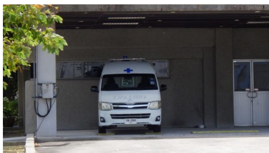
รูปที่ 3-37 รถพยาบาล