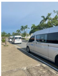
รูปที่ 3-35 รถรับ-ส่งพนักงานและคนงาน