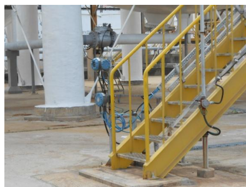
รูปที่ 3-46 Gas Detector

ภาพถ่ายประกอบการปฏิบัติตามมาตรการป้องกันและแก้ไขผลกระทบสิ่งแวดล้อม (ระยะดำเนินการ) โครงการโรงกลั่นน้ำมัน บริษัท สตาร์ ปิโตรเลียม รีไฟน์นิ่ง จำกัด (มหาชน)