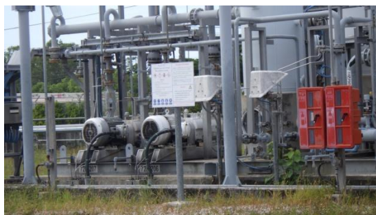
รูปที่ 3-25 Pump/Blower ของ VRU

ภาพถ่ายประกอบการปฏิบัติตามมาตรการป้องกันและแก้ไขผลกระทบสิ่งแวดล้อม (ระยะดำเนินการ) โครงการโรงกลั่นน้ำมัน บริษัท สตาร์ ปิโตรเลียม รีไฟน์นิ่ง จำกัด (มหาชน)