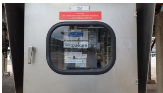
รูปที่ 3-7 Oxygen Analyzer