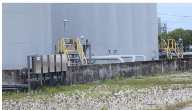
รูปที่ 3-48 คั่นกันของถัง B100