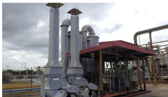
รูปที่ 3-18 Scrubber ที่ Sulfur Tank