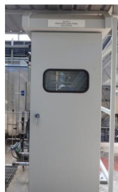
รูปที่ 3-14 CEMS ของปล่อง CDU

ภาพถ่ายประกอบการปฏิบัติตามมาตรการป้องกันและแก้ไขผลกระทบสิ่งแวดล้อม