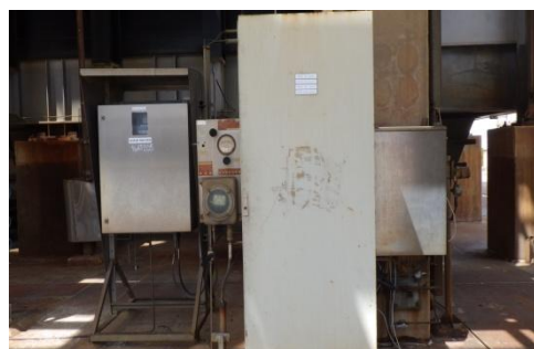
รูปที่ 3-8 CEMS ของปล่อง RFCCU

ภาพถ่ายประกอบการปฏิบัติตามมาตรการป้องกันและแก้ไขผลกระทบสิ่งแวดล้อม (ระยะดำเนินการ) โครงการโรงกลั่นน้ำมัน บริษัท สตาร์ ปิโตรเลียม รีไฟน์นิ่ง จำกัด (มหาชน)