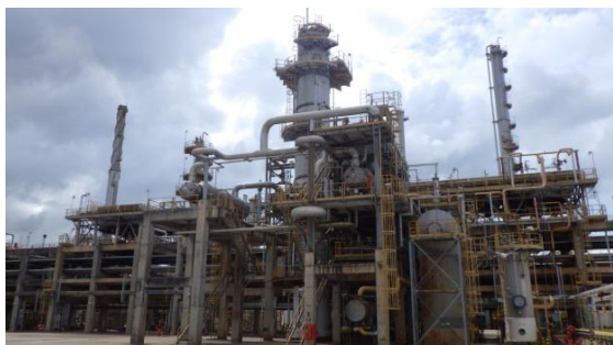
รูปที่ 3-3 Amine Regeneration Unit