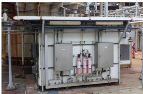
รูปที่ 3-9 CEMS ของปล่อง Tail Gas Treatment Unit