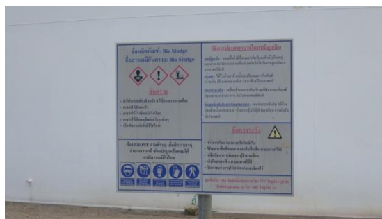
รูปที่ 3-38 ป้ายแสดงข้อมูลความปลอดภัย ของสารเคมี