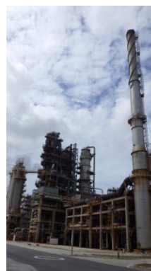
รูปที่ 3-6 Tail Gas Treatment Unit