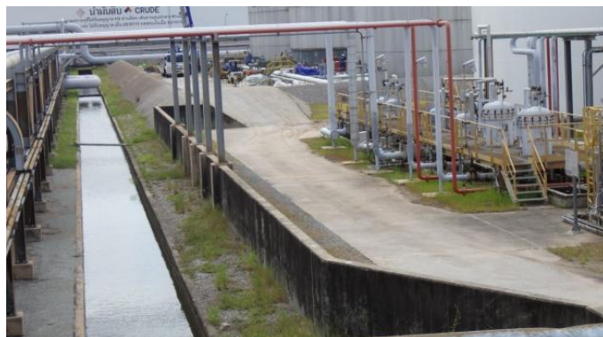
รูปที่ 3-47 คั่นกันของถังเอทานอล