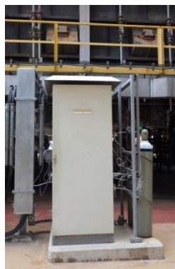
รูปที่ 3-15 CEMS ของปล่อง VDU