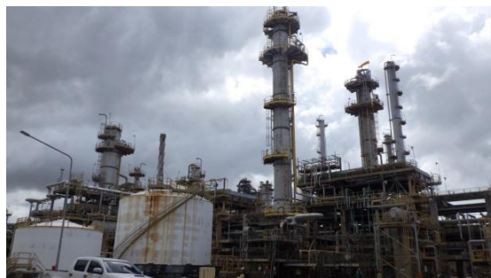
รูปที่ 3-4 Sour Water Stripping Unit