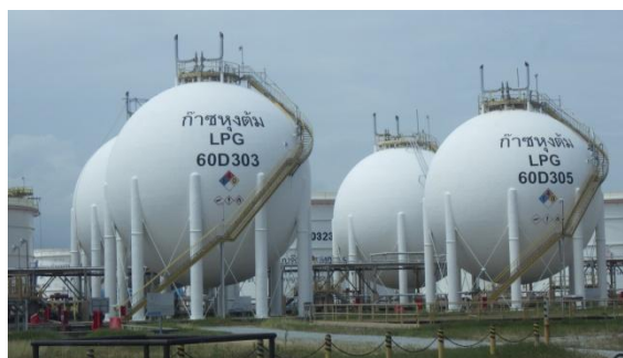
รูปที่ 3-55 ถัง LPG

ภาพถ่ายประกอบการปฏิบัติตามมาตรการป้องกันและแก้ไขผลกระทบสิ่งแวดล้อม (ระยะดำเนินการ) โครงการโรงกลั่นน้ำมัน บริษัท สตาร์ ปิโตรเลียม รีไฟน์นิ่ง จำกัด (มหาชน)