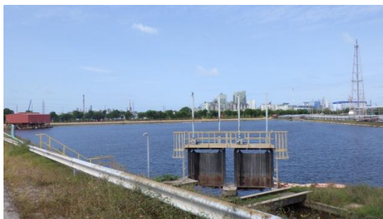
รูปที่ 3-27 บ่อน้ำดับเพลิง