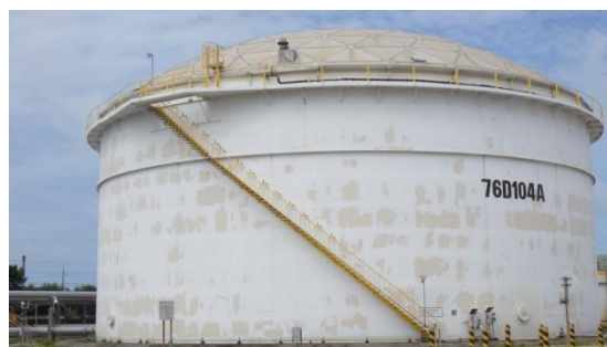
บ่อปรับสภาพน้ำเสียก่อนเข้าหน่วยเติมอากาศ (Equalization Tank)