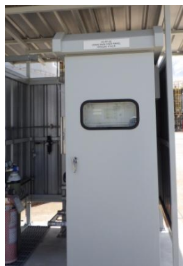
รูปที่ 3-12 CEMS ของปล่อง HRSG