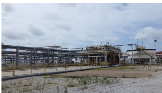
รูปที่ 3-26 ระบบบำบัดน้ำเสีย

ภาพถ่ายประกอบการปฏิบัติตามมาตรการป้องกันและแก้ไขผลกระทบสิ่งแวดล้อม (ระยะดำเนินการ) โครงการโรงกลั่นน้ำมัน บริษัท สตาร์ ปิโตรเลียม รีไฟน์นิ่ง จำกัด (มหาชน)