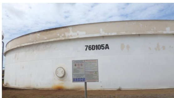
หน่วยบำบัดรวบรวมกากจุลินทรีย์ (Bio-Sludge Digester)